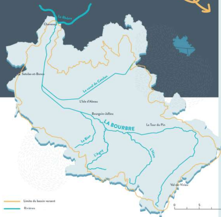
Carte du bassin versant de la Bourbre

Le territoire du bassin versant de la Bourbre présente des risques importants en cas d'inondation.