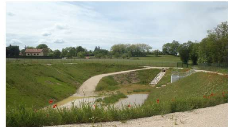
Bassin de rétention des eaux de Comberadix à Bourgoin-Jallieu

Quelques exemples de travaux réalisés ou en cours de réalisation dans le cadre du programme :