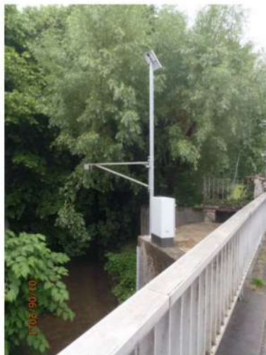
Station de mesure sur le Bion à Bourgoin-Jallieu

→ l' installation d'un réseau de stations de mesures permettant de mesurer le niveau des cours d'eau du territoire sur plusieurs zones à risques (suivi du niveau des cours d'eau en temps réel et avertissement envoyé par SMS aux mairies en cas de montée des eaux)