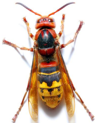
Frelon commun (jusqu'à 4 cm)