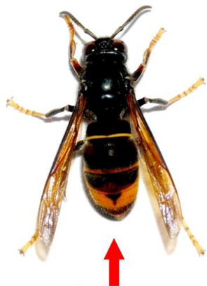
Frelon asiatique (taille réelle 3 cm)